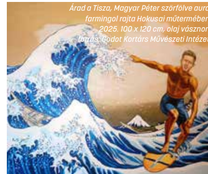
Árad a Tisza, Magyar Péter szörfözve auro farmingol rajta Hokusai műtermében 2025. 100 x 120 cm, olaj vásznon