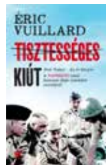
Éric Vuillard: Tisztességes kiút 21. Század Kiadó, megjelenés: 2025. szeptember 10.