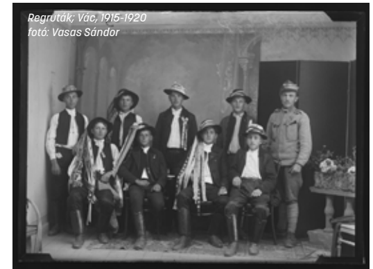
Pégruták; Vác, 1915-1920