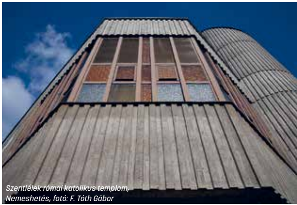
Szentlélek római katolikus templom, Nemeshegy