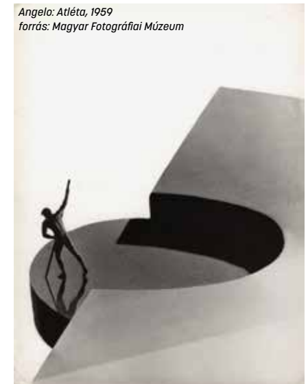
Angelo: Atléta, 1959