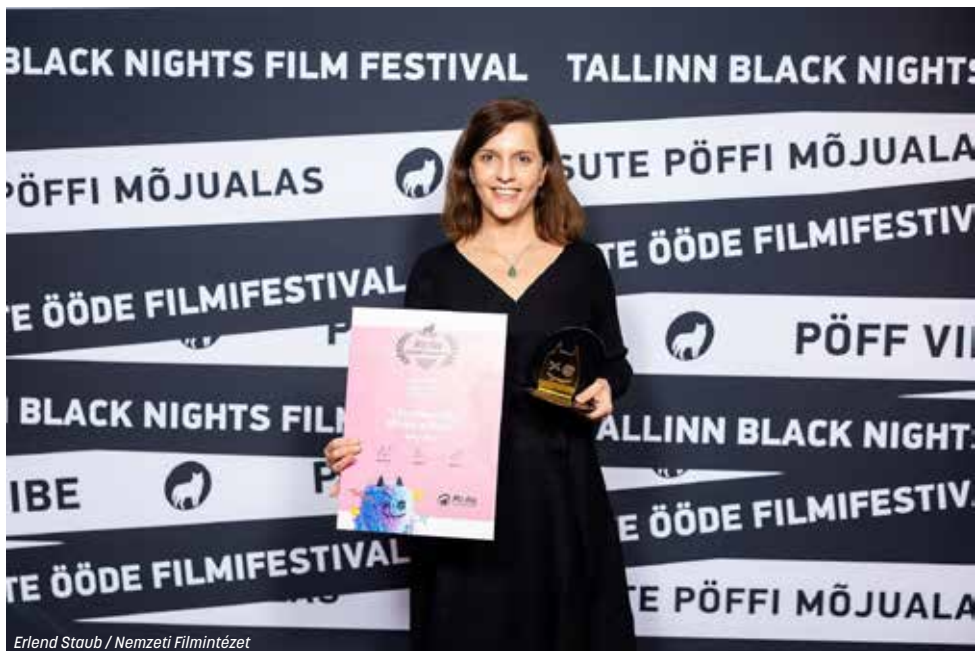
Erlend Staub / Nemzeti Filmintézet