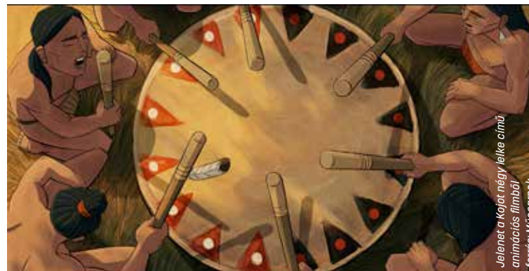
Jelenet a Kojot négy lelke című animációs filmből