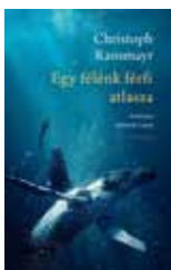
Christoph Ransmayr: Egy félénk férfi atlasza

Kalligram Kiadó, Megjelenés: 2024. november 27.